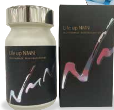
(1カプセル中にNMNを125mg配合)